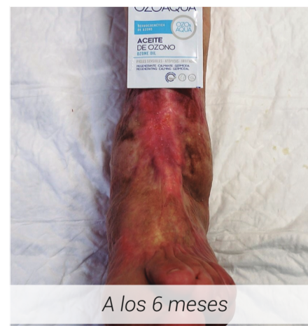
A los 6 meses