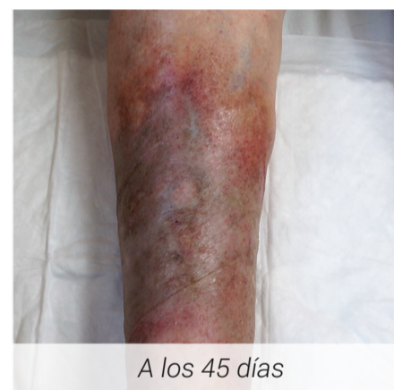
A los 45 días